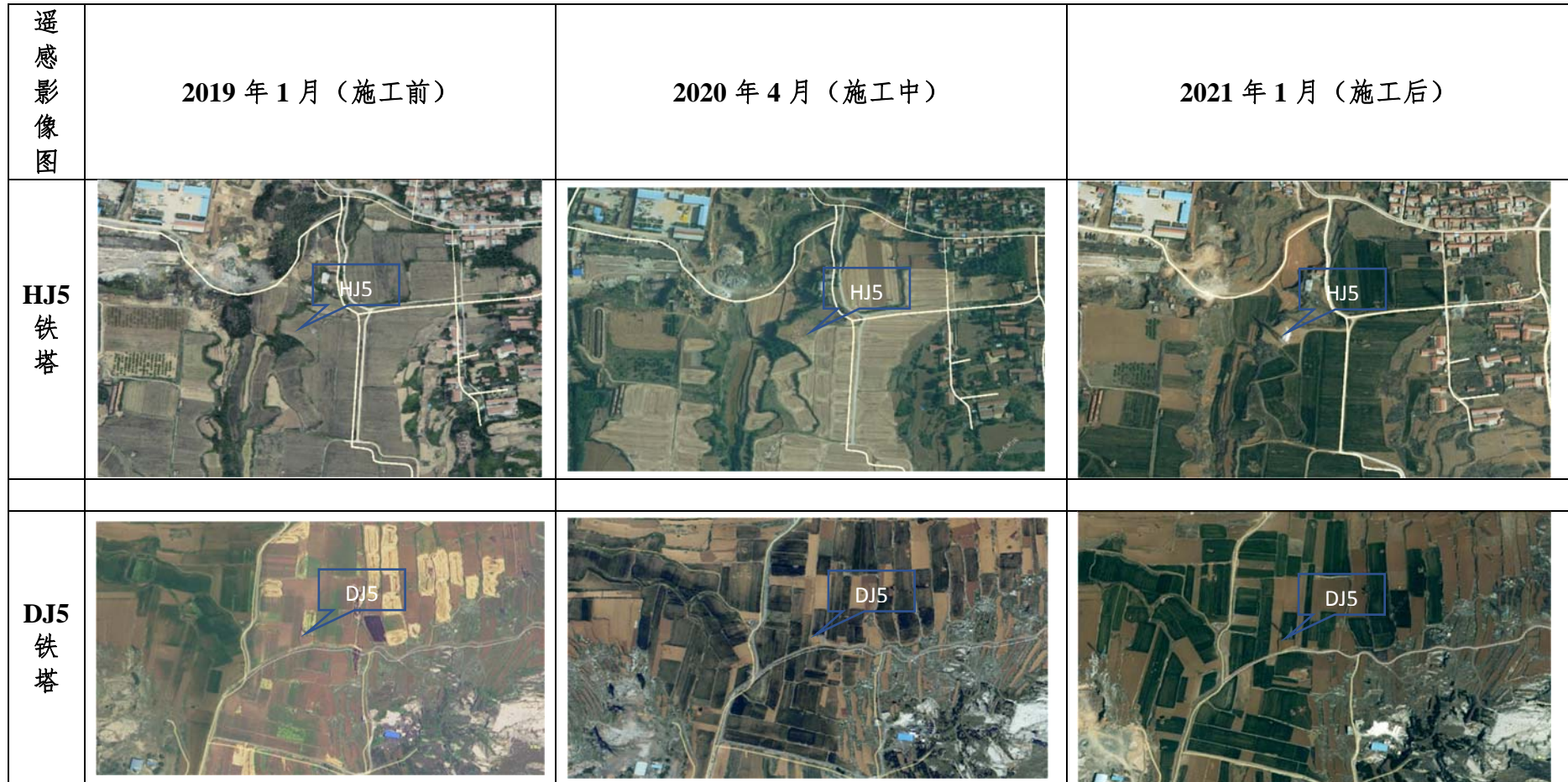
项目建设前后遥感影像图